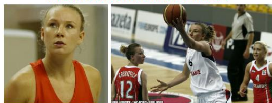
Joueuse de la génération 1989