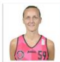
Joueuse de la génération 1986 1973

Club titre licence : Axeln BC Club-école Pôle : St Armand PH Pôle Espoirs : 1999-2000 Club amorce Pôle : St Armand PH Sortie Pôle : Centre Fédéral de Toulouse (NF2) Centre Fédéral Paris (NF1)