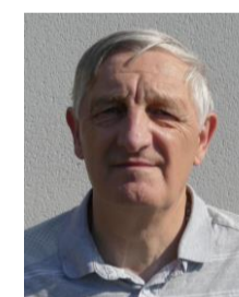
D. MOLLET Relation avec la Picardie