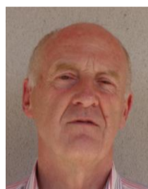
JL. DESRUMAUX Réfèrent ETR