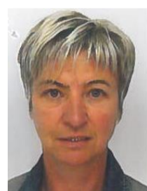
S. HEMBERT Plan Citoyen 3X3