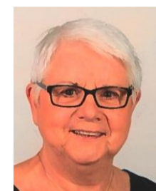
M. LEIGNEL Grands Evènements