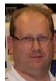
B. LEROY Plan Citoyen Incivilités